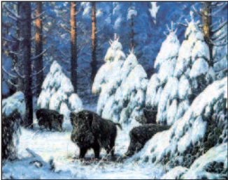
Gerhard Löbenberg, Schwarzwild im Winterwald

Die hier gezeigten Bilder behandeln das Thema „Jagdmalerei in Ostpreußen“.