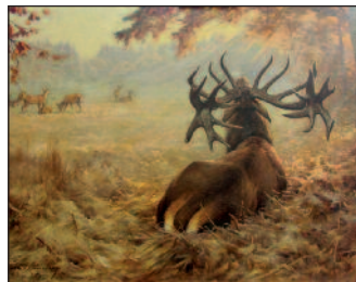
Gerhard Löbenberg, Der Fürst