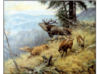
Gerhard Löbenberg, Im Sprung (Blattschuss)