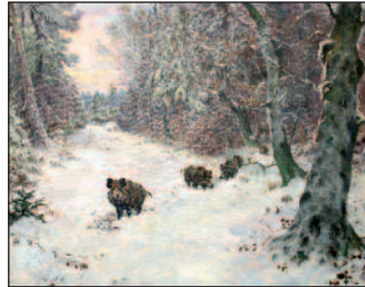
Reinhold Feussner, Wildschweine auf einer verschneiten Lichtung